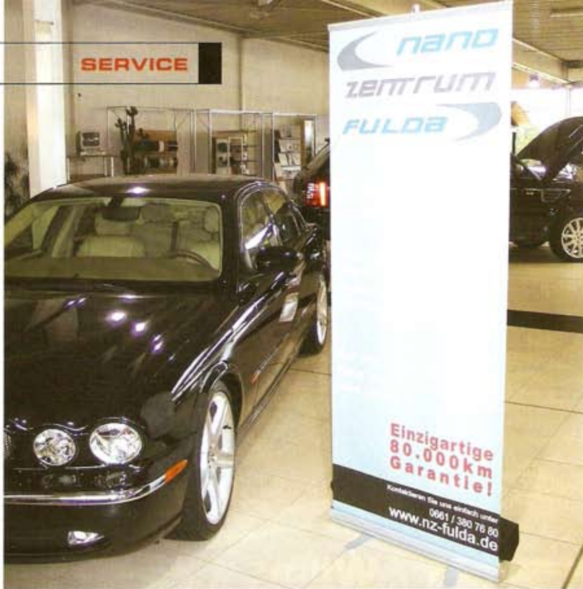
VON THOMAS SEIDENSTÜCKER

Aufmerksamkeit weckt: Nanozentrum ist auf den ersten Blick kaum zu übersehen. Deshalb wird im Autohaus Sorg jeweils speziell darauf hingewiesen.