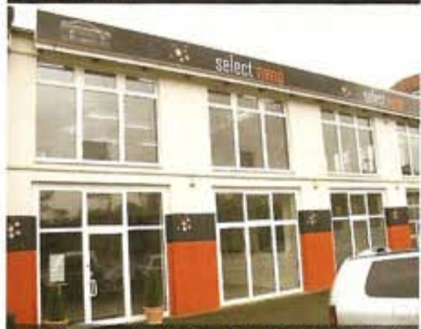
Der Firmensitz in Fulda mit passender CI

Für eine Franchise-Partnerschaft mit der Select Nano GmbH gelten folgende Bedingungen: